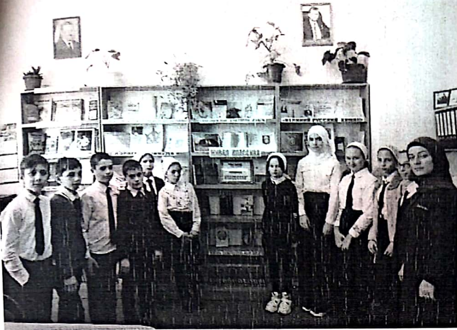
Экскурсия в сельскую библиотеку