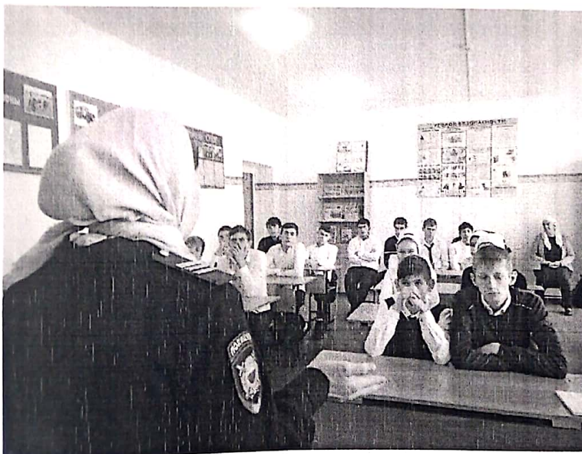
Встреча с представителем правоохранительных органов