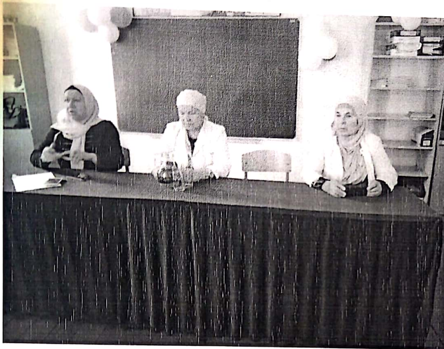
Встреча с работниками ФАП