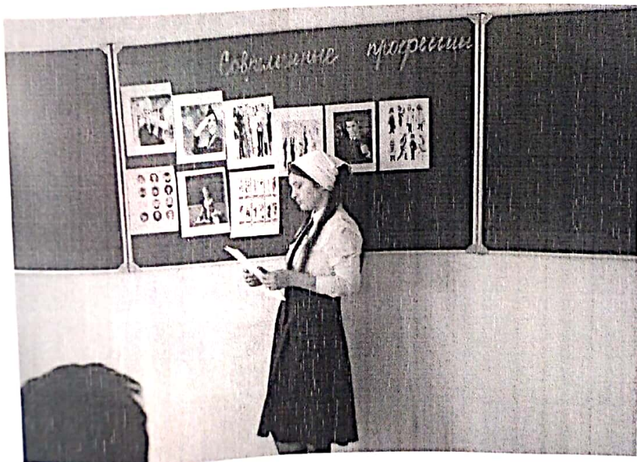
Классный час «Знакомство с современными профессиями»